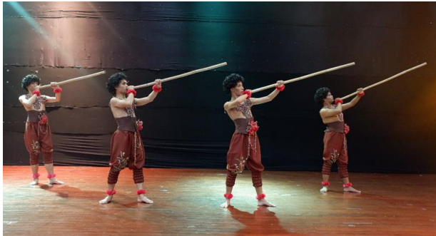
ภาพที่ 5 ท่าการเป่าลูกดอก