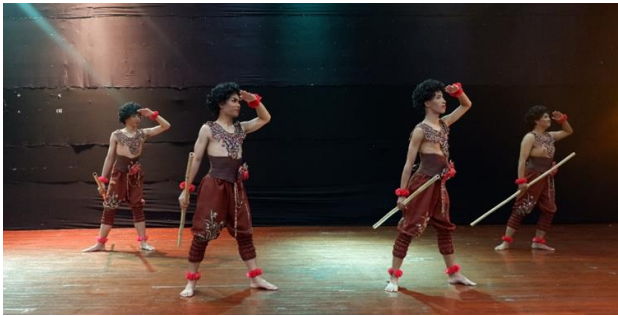
ภาพที่ 3 ท่าการวางแผนลำสัตว์

การสร้างสรรค์วัฒนธรรมของชาติพันธุ์มานิสู่การแสดงเชียร์ลีดเดอร์ ผู้วิจัยได้ค้นพบท่าทางสำคัญของชาติพันธุ์มานิจำนวน 8 ท่า และประยุกต์ท่าทางสำคัญดังกล่าวสู่การแสดงเชียร์ลีดเดอร์ โดยผู้วิจัยดำเนินการตามคำแนะนำจากผู้ทรงคุณวุฒิอย่างเคร่งรัด ดังภาพที่ 3 – 10