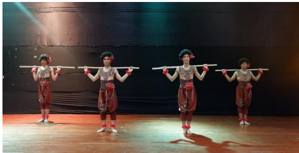
ภาพที่ 6 ท่าการแบกหามสัตว์

ที่มา : ยุทธพงษ์ ต้นประดู่ (5 พฤศจิกายน 2561)