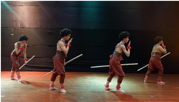
ภาพที่ 4 ท่าการต้อนรับผู้สัตว์