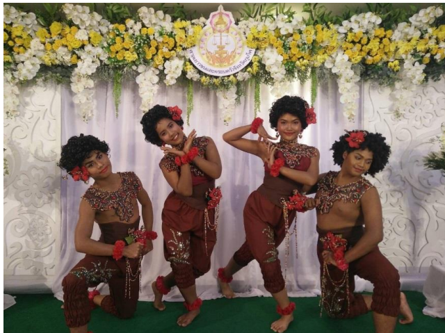
ภาพที่ 2 การออกแบบเครื่องแต่งกายชาติพันธุ์มานิผู้ชายและผู้หญิง ที่มา : ยุทธพงษ์ ต้นประดู่ (5 พฤศจิกายน 2561)