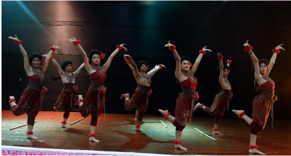
ภาพที่ 8 ทำการเฉลิมฉลอง

ที่มา : ยุทธพงษ์ ต้นประดู่ (5 พฤศจิกายน 2561)