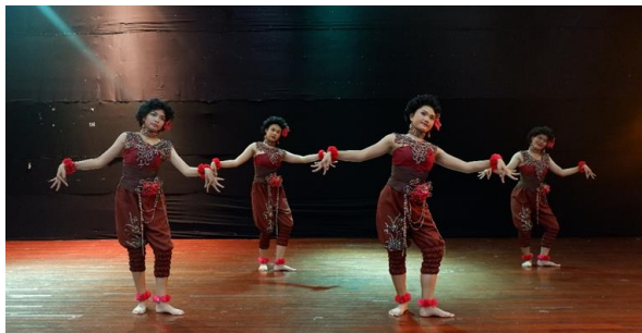
ภาพที่ 7 ท่าการเก็บลูกไม้ป่า