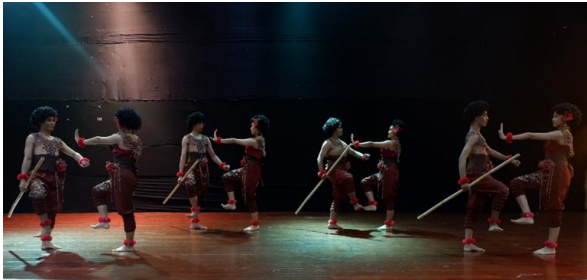
ภาพที่ 9 ทำการบอกรัก