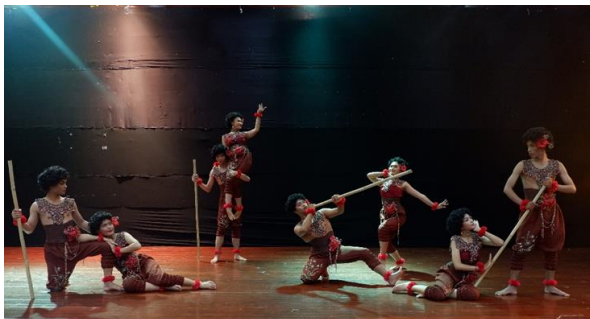
ภาพที่ 10 ทำการเกี่ยวพาราสี