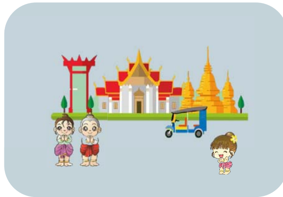
องค์ความรู้พื้นฐานทางสังคมและ ความเป็นมนุษย์